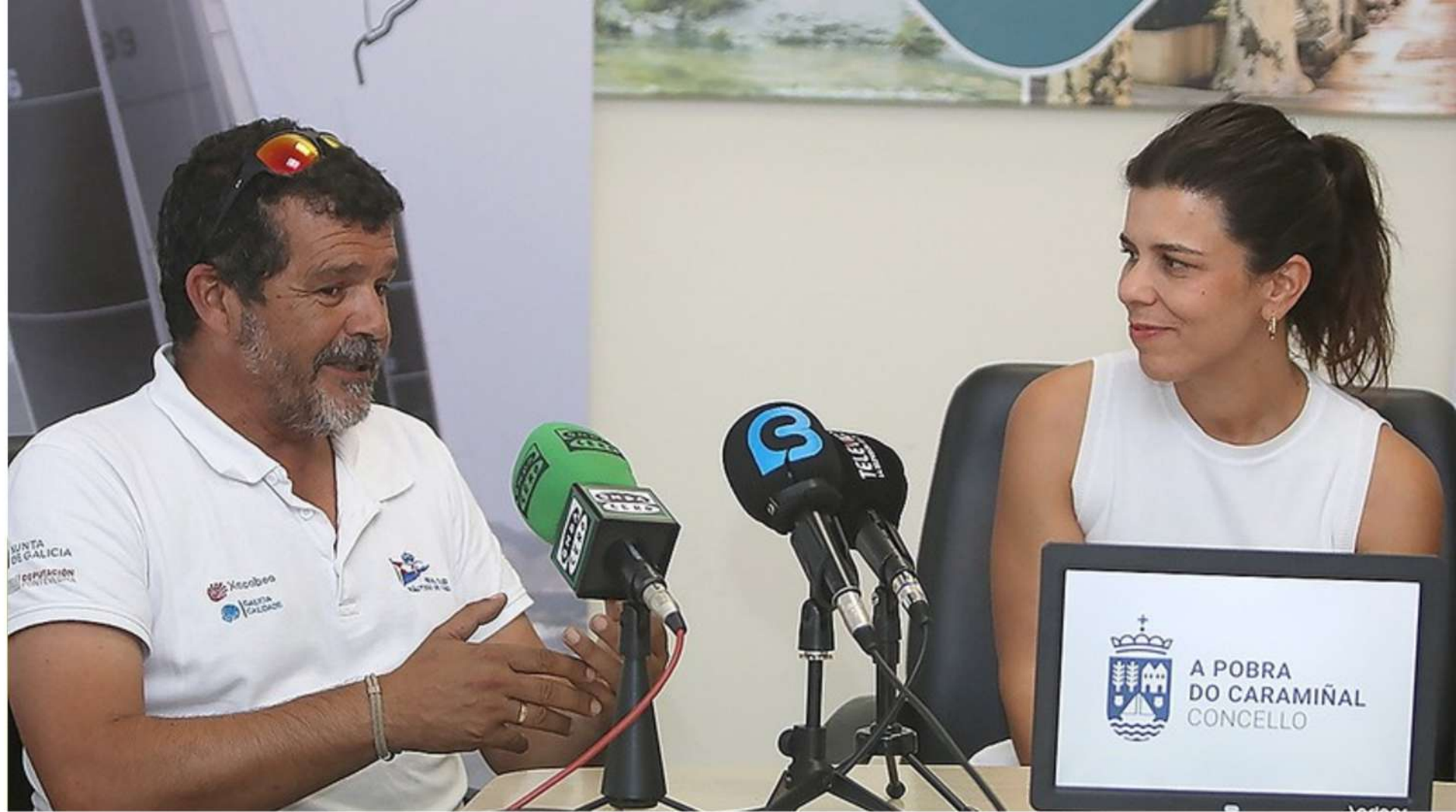
PRESENTACIÓN DE LA REGATA EN A POBRA DO CARAMIÑAL (5/08/2025)